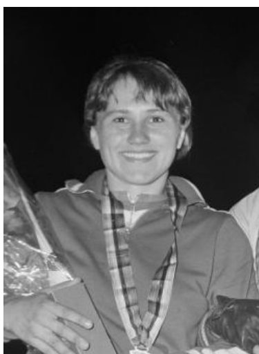
Чемпіонка світу Ободовська Раїса