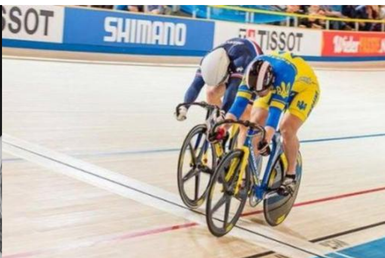
Гонки на треку