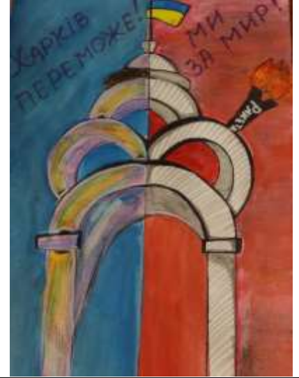
Учні КЗ «Харківської гімназії №13 Харківської міської ради Харківської області»