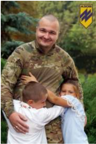
Фотогурток «Позитив» КЗ «ЦДЮТ» Південної міської ради Харківського району