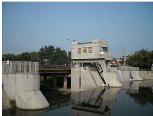
Гончарівський міст та гребля

На початок ХІХ століття Гончарівка значно збільшилася. Як свідчить план міста 1817 року слобода на початку ХІХ століття злилася з Різдвяною (сучасна Конторська) вулицею. В той час, на місці колишньої Гончарівської левади, яка відділяла слободу від міста, утворилася Середньо-Гончарівська вулиця, яку в другій половині ХІХ століття було перейменовано на Гончарівський бульвар. Наприкінці ХІХ століття тут була відкрита велика типолітографія (пізніше друкарня № 2). У 1973 р. Гончарівський бульвар перейменували на вулицю Конєва, 2023 року під час деколонізації було повернуто назву Гончарівський бульвар. У 1937 році на річці Лопань, напроти Гончарівського бульвару, була побудована Гончарівська гребля, що регулювала рівень води в річках Харкова.