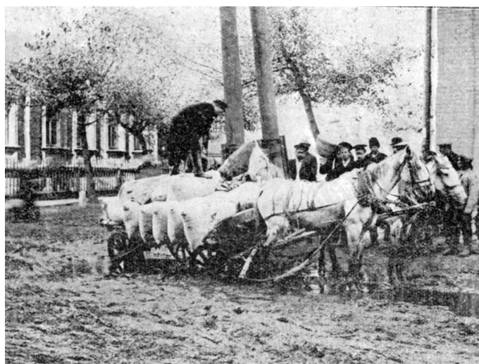
Кузнечна вулиця, фото XIX ст.

Вулиця Кузнечна – це свідчення багатого минулого міста, збережена в архітектурному стилі кінця XIX - початку XX століття, з дво- та триповерховими будинками, що надає вулиці затишної атмосфери.