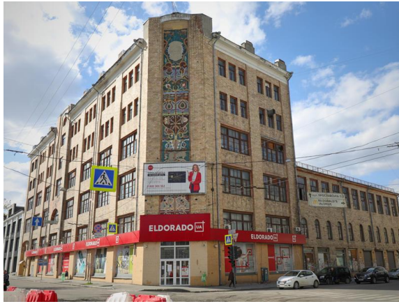
Початок вулиці Коцарської, 2020-й рік

Вулиця КУЗНЕЧНА (довжиною 800 метрів) починається від Університетської вулиці, біля Нетеченського моста через річку Харків, та Рибного майдану. Через Кузнечний провулок з'єднується з проспектом Героїв Харкова. Кузнечну вулицю перетинають Лопатинський та Подільський провулки. Від вулиці відходять Троїцький та Плетнівський провулки, а також Кузнечний в'їзд. Також від Кузнечної вулиці відгалужується безіменний в'їзд, що простягається вздовж річки Харків. Кузнечна вулиця знаходиться у Основ'янському районі міста Харкова. Близько 10-15 хвилин пішого ходу від станцій метро «Майдан Конституції» та «Левада» [12].