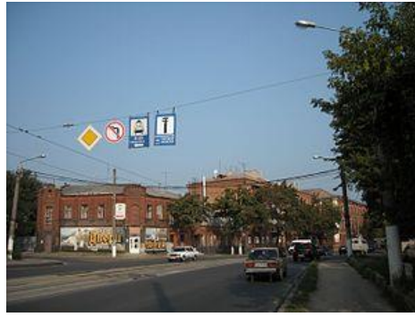
Гончарівка, вигляд зі сторони Гончарівського моста

На початок ХІХ століття Гончарівка значно збільшилася. Як свідчить план міста 1817 року слобода на початку ХІХ століття злилася з Різдвяною (сучасна Конторська) вулицею. В той час, на місці колишньої Гончарівської левади, яка відділяла слободу від міста, утворилася Середньо-Гончарівська вулиця, яку в другій половині ХІХ століття було перейменовано на Гончарівський бульвар. Наприкінці ХІХ століття тут була відкрита велика типолітографія (пізніше друкарня № 2). У 1973 р. Гончарівський бульвар перейменували на вулицю Конєва, 2023 року під час деколонізації було повернуто назву Гончарівський бульвар. У 1937 році на річці Лопань, напроти Гончарівського бульвару, була побудована Гончарівська гребля, що регулювала рівень води в річках Харкова.